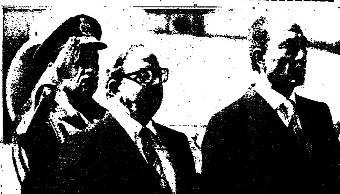
الرئيس السادات يستقبل رئيس الدولة السيد اسحق ناسون في مطار القاهرة الدولي ، يوم الاحد ٢٦-١٠-١٩٨٠